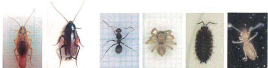
チャハネゴキブリ クロゴキブリ アリ類 クモ類 ワラジムシ ヒラタチャタテ