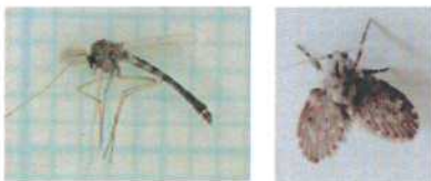
ユスリカ チョウバエ