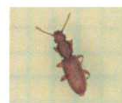
ノキリヒラタムシ